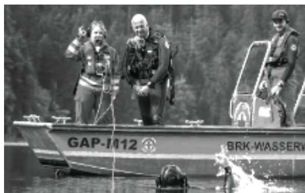
Einsatz des Rettungstauchers am Eibsee

Sollte dies Ihr Interesse geweckt haben und Sie möchten gerne noch mehr über den Verein wissen, melden Sie sich bei Sandro Leitner Tel.: 0171/1771353 oder schicken Sie eine E-Mail an: info@wasserwacht-grainau.de.