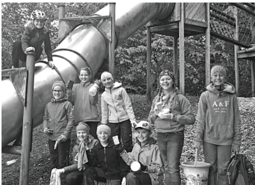
Neun Kinder der Grundschule Grainau beim Putzeinsatz an der großen Rutsche am Spielplatz