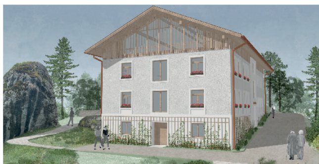
Planungen für das Grainauer Rathaus nach der Sanierung

Unter www.gemeinde-grainau.de bleiben Sie informiert. ER