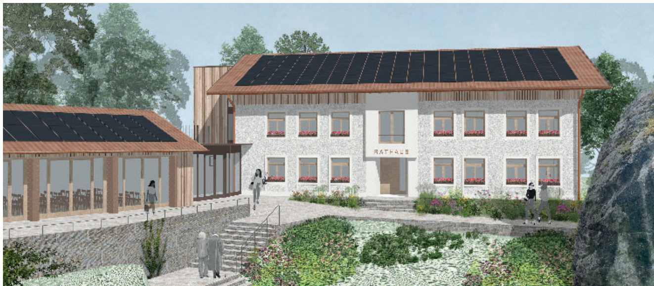
Plandarstellung des Rathausgebäudes nach der Sanierung