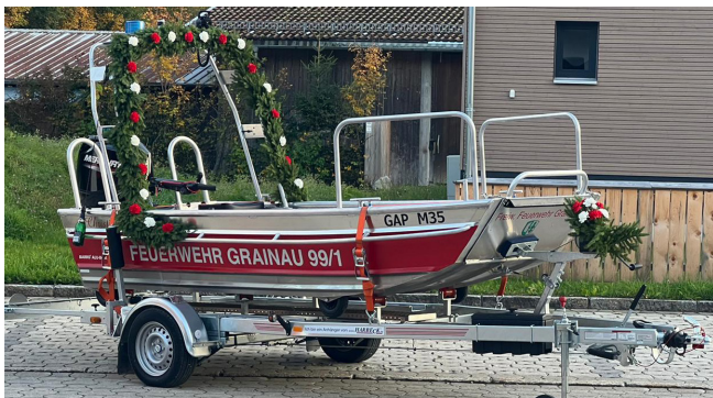
Das neue Rettungsboot bei der Einweihung

Das neue Rettungsboot RTB 1 mit dem Funkrufnamen Florian Grainau 99/1 samt Trailer wurde am 07.10.2022 feierlich durch Herrn Pfarrvikar Pazhoora eingeweiht. Die mitgelieferten Kufen können im Winter anstatt der eingebauten Vollgummiräder ausgetauscht werden und das Boot kann somit als Eisrettungsschlitten eingesetzt werden. Der Gesamtpreis des Bootes samt Trailer beträgt 37.136 €, wobei 70% durch Fördermittel des G7-Gipfel übernommen werden.