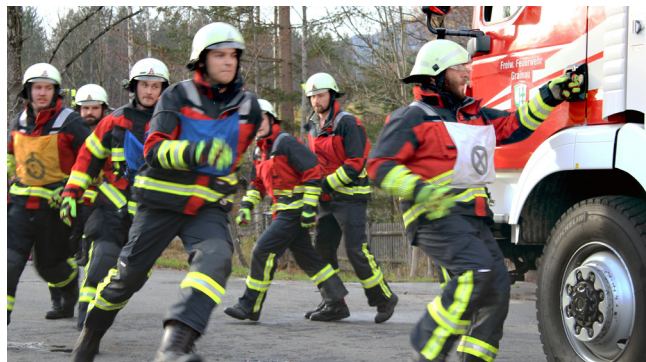
Feuerwehrmänner beim Leistungsabzeichen

Eine der umfangreichen Aufgaben einer Feuerwehr ist der Schutz der Bevölkerung vor Feuer bzw. die Eindämmung von Schadensereignissen. Eine weitere sehr wichtige Aufgabe ist es, Personen aus verunfallten Fahrzeugen zu befreien. Um diesen Aufgaben gerecht zu werden, bedarf es ständiger Ausbildungen, Schulungen und Übungen. Eine besondere Art dieser Ausbildung sind die Leistungsprüfungen. Hierbei werden die wichtigsten Handgriffe in wochenlanger Vorbereitung geübt und am Tage der Leistungsprüfung abgenommen.