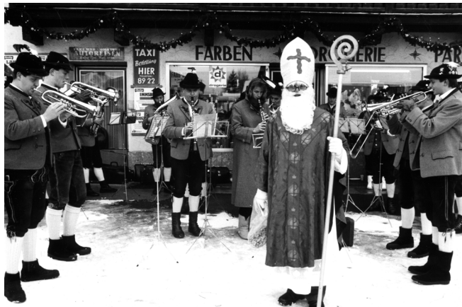
Der Christkindlmarkt vor 40 Jahren am Unteren Dorfplatz