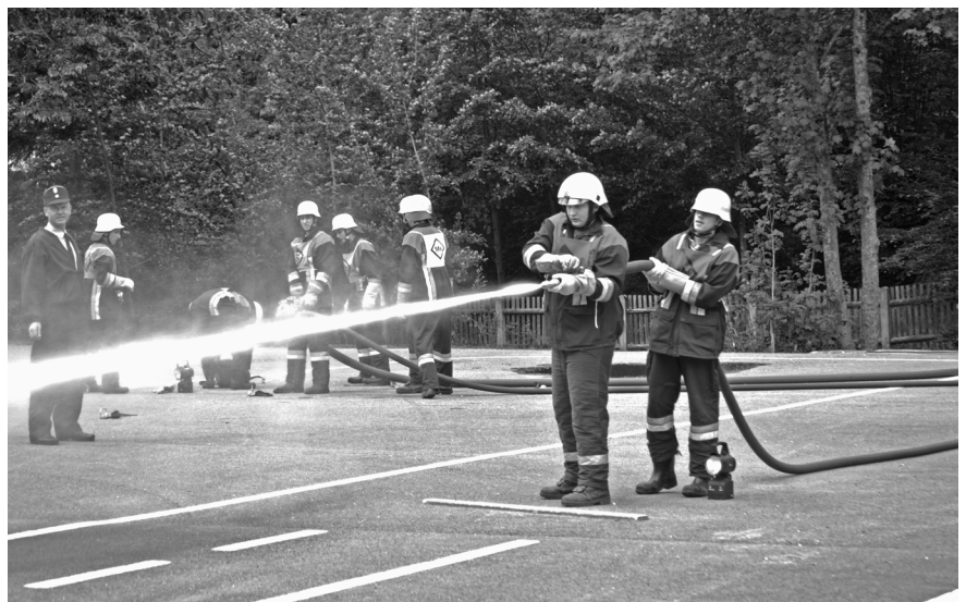
Junge Grainauer Feuerwehrmänner bei der Leistungsprüfung „Gruppe Löscheinsatz“