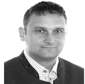
Stephan Märkl 1. Bürgermeister