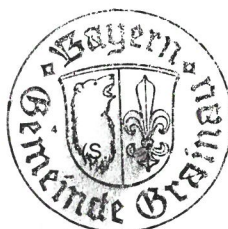
Stephan Märkl 1. Bürgermeister