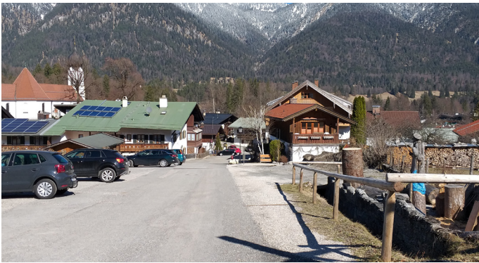
Am Neuneralmweg entsteht noch heuer ein neuer Parkplatz mit 27 Stellplätzen für PKWs

Nachdem letzten Herbst bereits die Wasserleitungen rund um den Oberen Dorfplatz neu verlegt wurden, geht es im Frühjahr mit weiteren unterirdischen Arbeiten weiter.