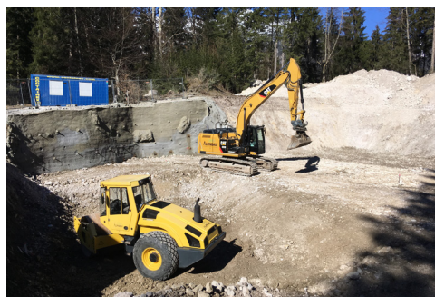
Erdarbeiten für den neuen Hochbehälter an der Christlhütte

Wie bereits auf Seite 2 erwähnt, wird die Finanzierung der Baumaßnahme über zwei Jahre laufen und über Kredite abgedeckt. Der jetzige Hochbehälter besteht aus zwei Kammern mit jeweils 600 Kubikmetern Volumen, wobei davon nur je 400 Kubikmeter genutzt werden können. Damit in der Zukunft Grainau, auch in den Sommermonaten, optimal versorgt