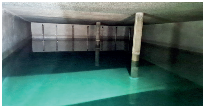
Eine Kammer des neuen Hochbehälters

Die Arbeiten am Neubau des Trinkwasser-Hochbehälters an der Christlhütte sind abgeschlossen und der Betrieb wurde aufgenommen. Dieser Bau war notwendig geworden, da der Vorgänger mit einem Fassungsvermögen von 600 Kubikmetern Wasser nicht mehr den Anforderungen entsprach. Der Spitzenverbrauch in der Gemeinde in der Hochsaison liegt bei 2 000 Kubikmetern pro Tag. Daher entschloss man sich 2019 diesen neuen Behälter zu bauen. Die neue Anlage verfügt über zwei Kammern mit je 1000 Kubikmetern.