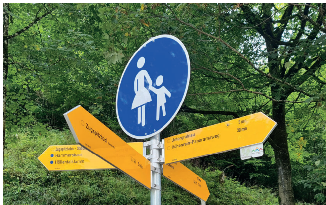
Die neuen einheitlichen Hinweisschilder in Grainau

Das Leader-Projekt „Beschilderungssystem für Wander- und Spazierwege im Landkreis“ endet im Dezember diesen Jahres. Die Gemeinde Grainau ist Teil dieses Projektes und nach und nach werden im Gemeindegebiet alle Hinweisschilder angebracht bzw. ausgetauscht. Dies soll in der Wegebeschilderung innerhalb der Zugspitz Region und zu den Nachbarregionen (Weilheim-Schongau, Bad Tölz - Wolfratshaus, Tirol) die Lücken schließen, um ein einheitliches System mit Wiedererkennungswert zu installieren. Es erfolgt ein wichtiger Lückenschluss zwischen den bereits bestehenden Beschilderungssystemen, gleichen Standards, in der Alpenwelt Karwendel und den Ammergauer Alpen. Es entsteht erstmals eine durchgehend einheitliche Wanderwegebeschilderung für das gesamte Gebiet der Zugspitz Region im Landkreis Garmisch-Partenkirchen. Durch die Umsetzung der einheitlichen Beschilderung erfolgt auch eine Art der Besucherlenkung, um sensible Naturräume vor Betretung zu schützen.