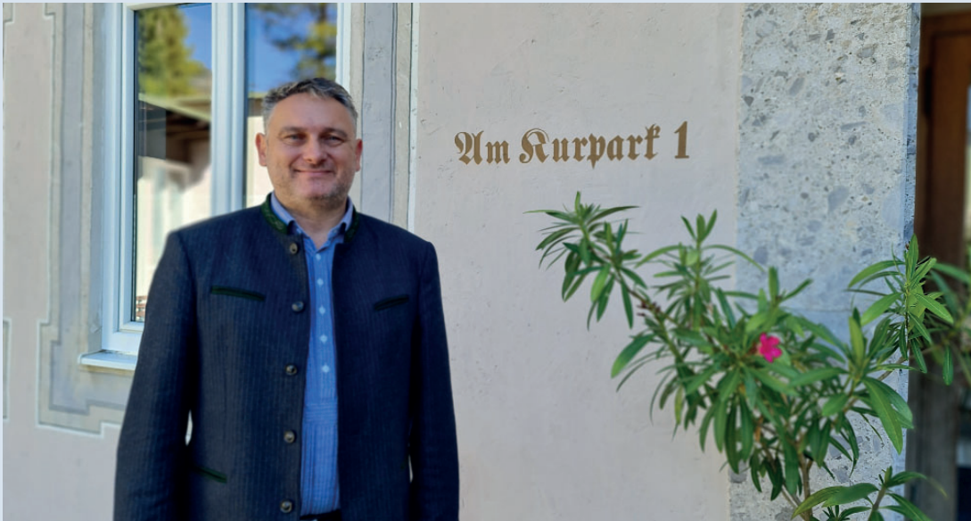
1. Bürgermeister Stephan Märkl