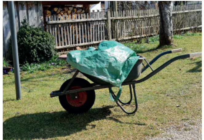
Herbstzeit ist Aufräumzeit im Garten