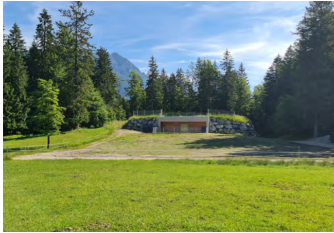
Hochbehälter „Christlhütte“ nach dem Abbruch des alten Gebäudes mit den Trinkwasser-Hochbehältern

Die alte Hochbehälter-Anlage „Christlhütte“ wurde durch die neue Anlage ersetzt (wir berichteten). Daher war es im zweiten Schritt nötig, das alte Gebäude abzureißen. Dies ist abgeschlossen und der Platz wurde renaturiert.