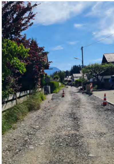
Straßenarbeiten „Am Krepbach“

Regenwasserkanal neu gebaut. Die ausgekofferte und asphaltierte Straße erhält im Anschluss noch „Bavaria Leuchten“ als neue Straßenbeleuchtung. Bild/Text: ER