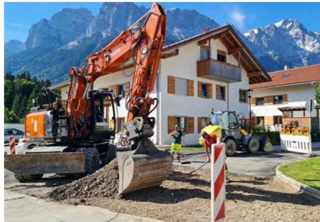
Asphaltierungsarbeiten in der Lärchwaldstraße

Folgende Straßenabschnitte werden heuer mit einer notwendig gewordenen neuen Asphaltdecke versehen: Alpenrosenweg, Bärenau, Baderseeweg, Schwarzenkopfweg, Waxensteinstraße vom Bahnübergang bis zum Dorfplatz sowie Zugspitzstraße vom Dorfplatz bis zum Waldwinkl. Ebenso erhält die Lärchwaldstraße und der Unterwaldweg eine neue Asphaltdecke.