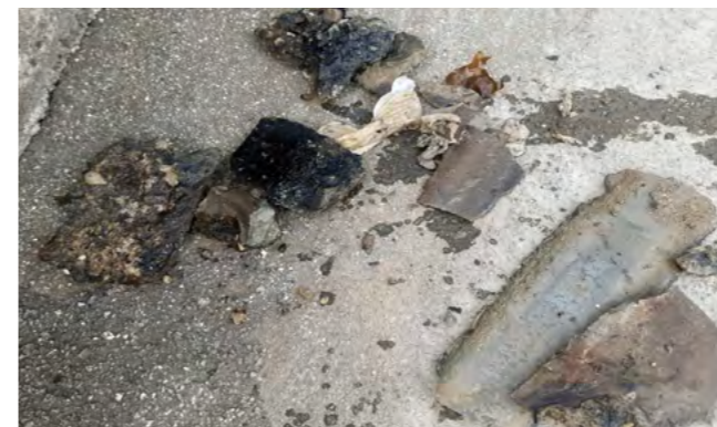
Ablagerungen, die aus dem Kanalnetz geholt wurden

Bereits mehrfach berichteten wir über die Verschmutzung und Verunreinigung der Abwasserkanäle, welche durch unsachgemäße Entsorgung von Fette, Öle und dergleichen verursacht wurde.