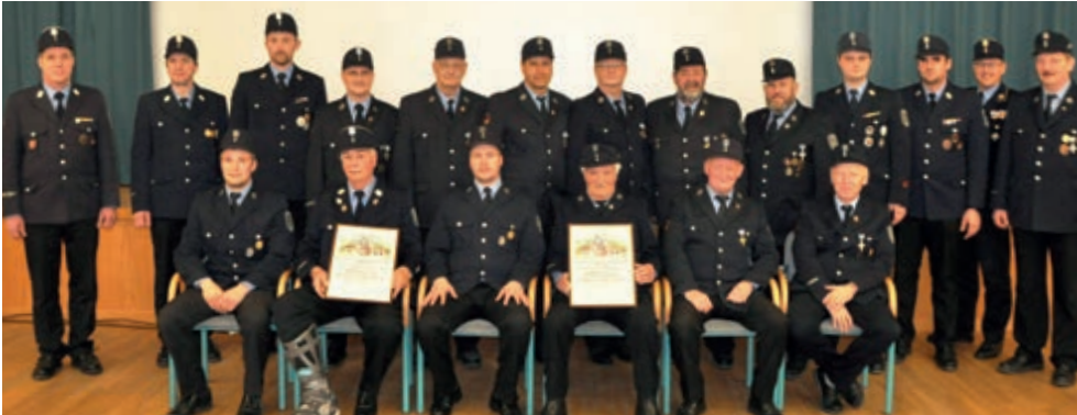
Die Kommandantur und der Vereinsvorstand mit Geehrten und Beförderten der Grainauer Wehr

Verdiente und langjährige Feuerwehrler wurden bei der diesjährigen Jahreshauptversammlung der Freiwilligen Feuerwehr Grainau geehrt.