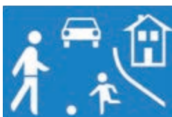
Hinweisschild - Verkehrsberuhigter Bereich

Bei einem verkehrsberuhigten Bereich sind Fußgänger und Fahrzeuge gleichberechtigt.