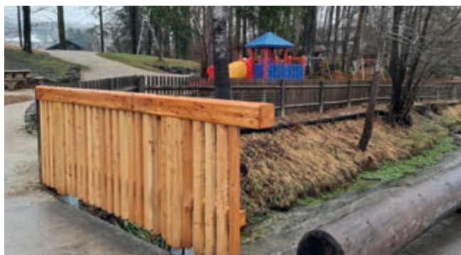
Neues Brückengeländer am Spielplatz in Grainau

Um die Verkehrssicherheit auch weiterhin zu gewährleisten, ersetzen die Mitarbeiter des Bauhofes momentan nach und nach die Brückengeländer an den Wander- und Spazierwegen.