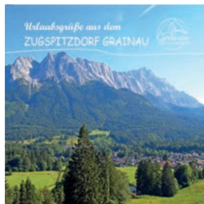
Das Musikcover von 2024 mit den Musikstücken von vor 36 Jahren