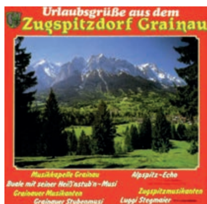
Das Originalcover der Schallplatte bzw. Musikkassette von 1988

Anfang des Jahres wurden diese Aufnahmen digitalisiert und können ab sofort auf vielen Plattformen wie u.a. YouTube, Tidal, Spotify, Deezer und vielen mehr abgerufen werden. Unter dem Link https://www.artistcamp.com/SmartLinks/9003549924883/ findet man alle Anbieter und