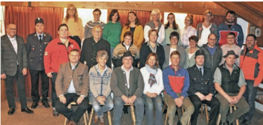
Vorstandschafft des Christkindlmarktes zusammen mit den beteiligten Vereinen